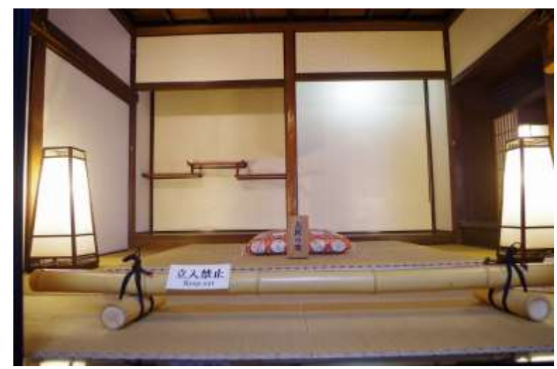
草津宿本陣「上段の間」