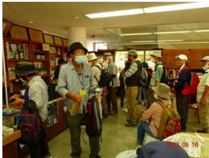
道灌蔵での試飲とお買い物