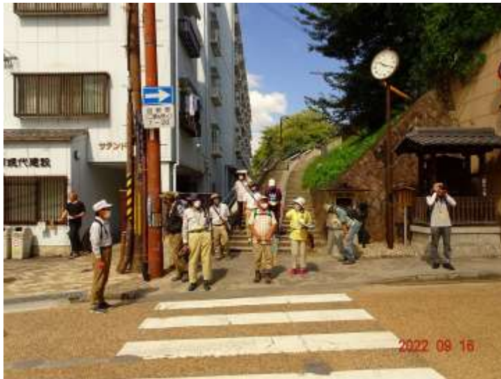
東海道・中山道分岐点