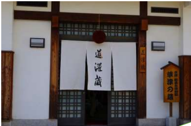
暑いので皆さん 日陰に整列