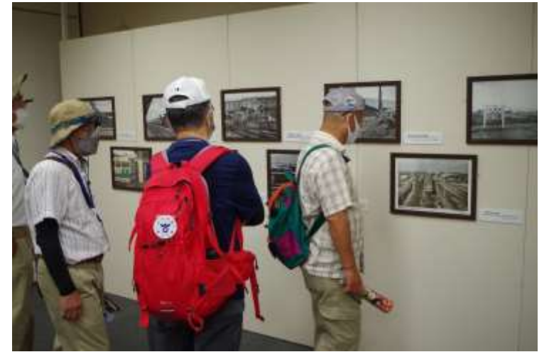
草津宿街道交流館