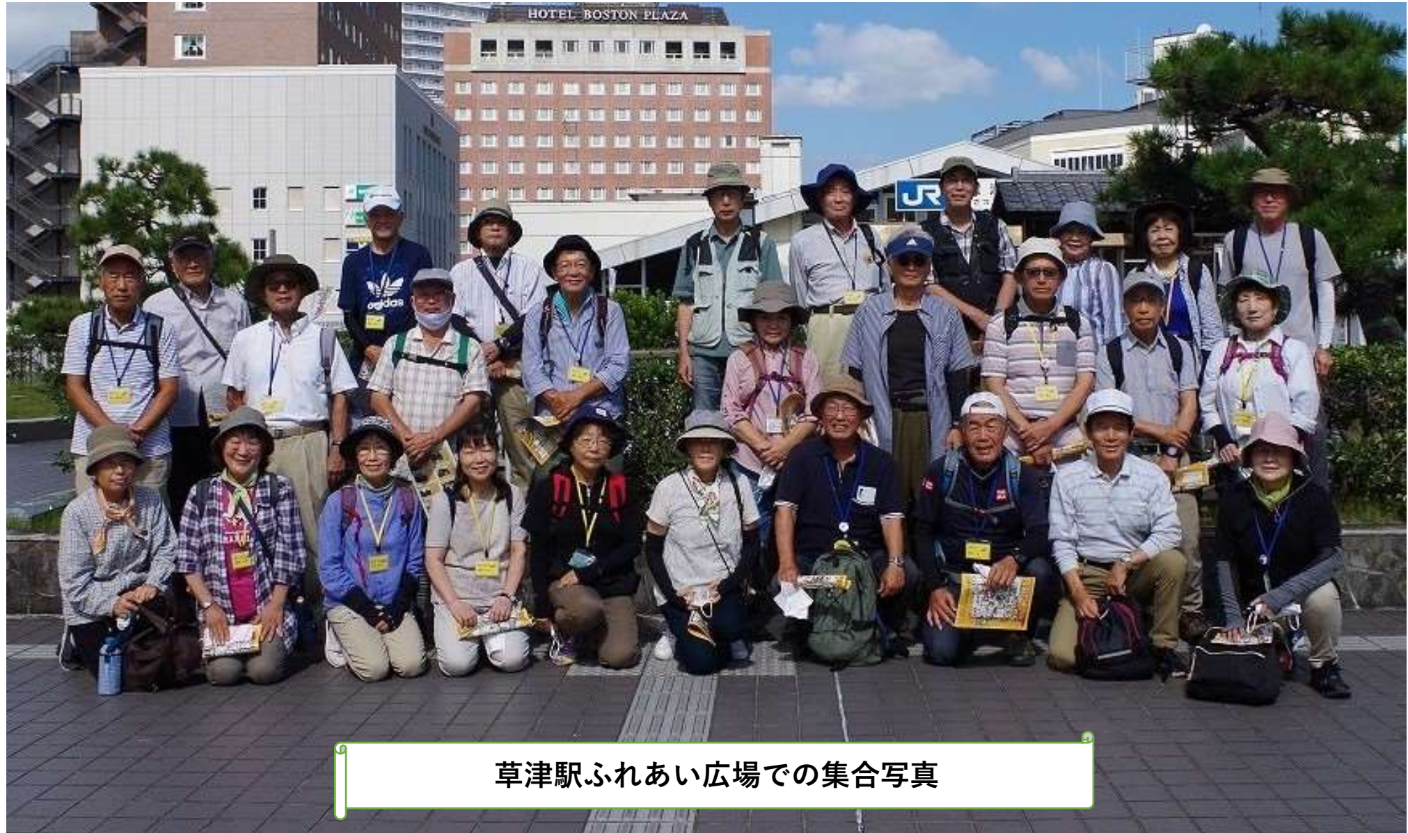
草津駅ふれあい広場での集合写真