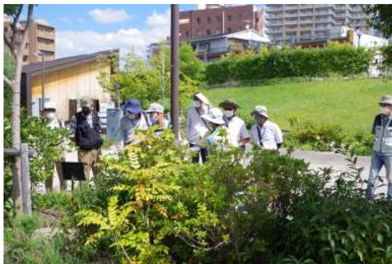
旧草津川跡地/de愛ひろば