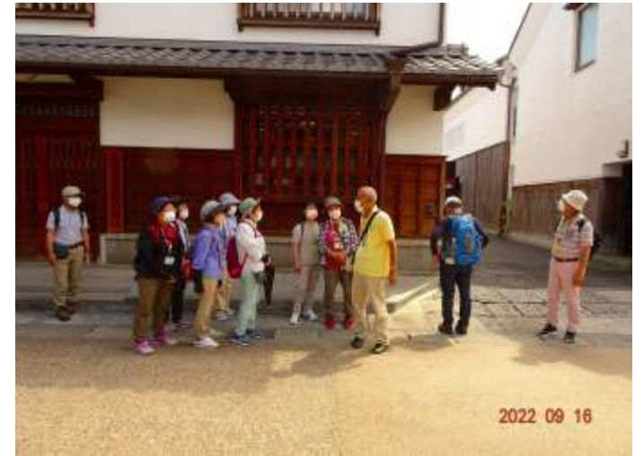
宿場一の古刹「常善寺」