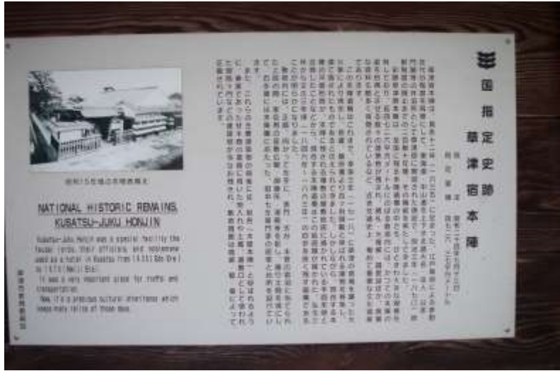
草津宿本陣案内板