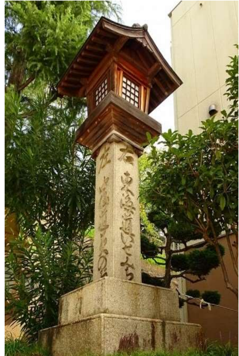
追分道標「左中山道・右東海道」