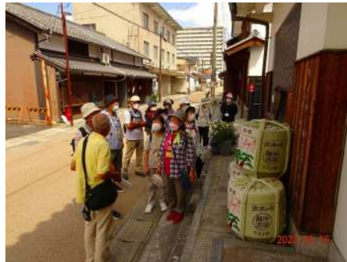
さあ試飲の時間です！