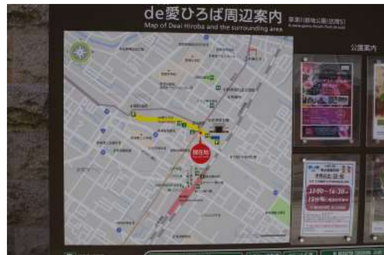
旧草津川跡地/de愛ひろば案内板