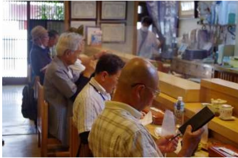
寿司清での昼食風景