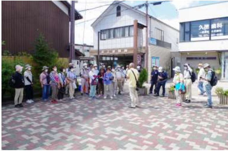
ガイドさんとお別れ